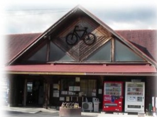
自転車を貸し出してくれるレンタルステーション。自転車のマークが、サイクリストを歓迎してくれる。