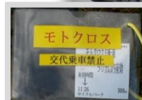
レンタルMTBも豊富！芝生のBMXコースへ！300円で30分。自転車レンタル代込でお得。