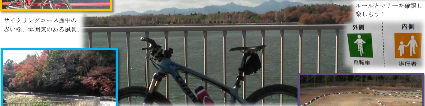
ルールとマナーを確認し楽しもう！