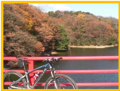
サイクリングコース途中の赤い橋。霽り気のある風景。