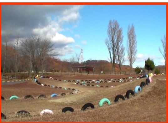
芝生のなだらかなバンク・ゆるやかな斜度のジャンプ・誰もが安全にモトクロス気分を味わえる。