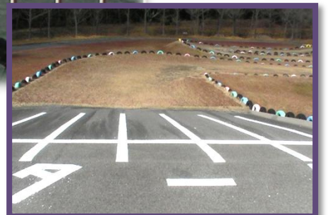
本格的 BMX コース同等のスタート台。安全に楽しめるコース設計が魅力だ。