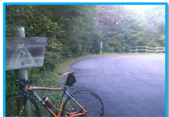
コース幅は広いが、狭くなる箇所や対面通行部分も有るので、スピードには十分注意して走行しよう!