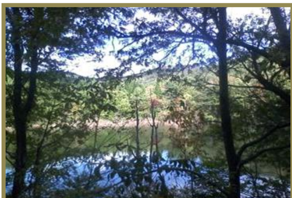
コース途中の左手には、木々の合間から湖沼を望める場所が有り、高原気分を満喫できる!