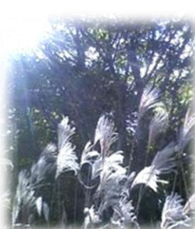
秋には、スキの穂が高原の清涼な風にゆれていて、視覚的にも癒される景色のある落ち着いたコースだ。