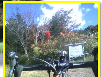
標高が高いだけに、コースわきの樹林帯では、季節に応じた木々の変化が顕著で味わいがある。