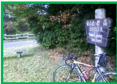
最高点標高 965mを示す看板 元々標高が高いコースなので手軽に高原サイクリングを満喫可能!