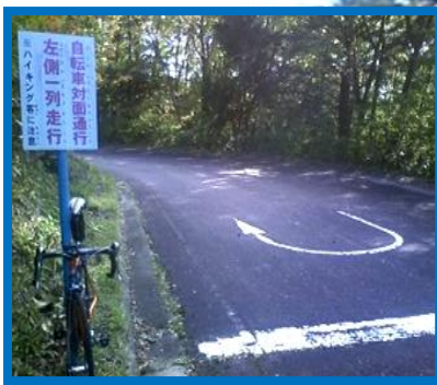
コースは、遊歩道と交差する部分や対面通行となる部分が有る。サインを守って安全に楽しもう!