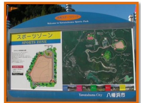
年間平均気温が17度の気候温暖な八幡浜市。山中のスポーツパークに常設するコースだ。