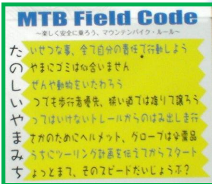
ルール の明示こそ、MTB の社会的地位向上には欠かせない