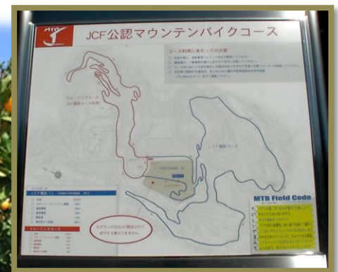
競技公認コースを示す看板に気分も高揚