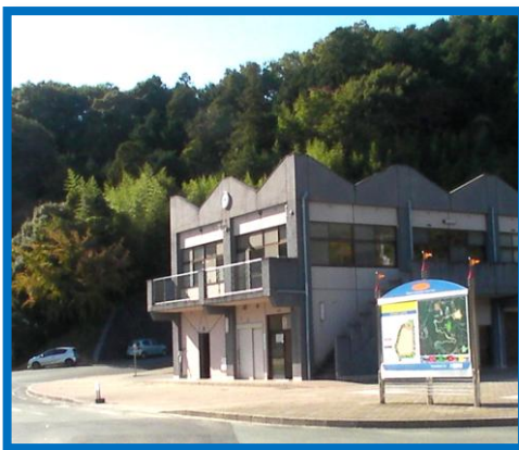
利用可のシャワー施設も備える管理棟が嬉しい。