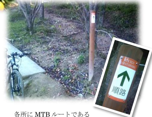
各所に MTB ルートであることを示す順路看板があり、集中してスポーツ走行が可能。