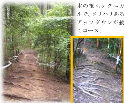
木の根もテクニカルで、メリハリあるアップダウンが続くコース。