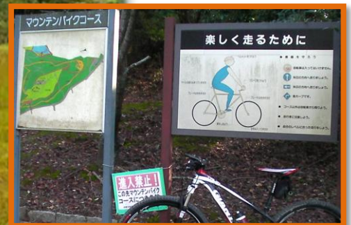
MTB で楽しくスポーツする為のフィールドコードが有る公認コースだ。