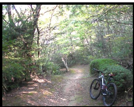
木漏れ日の樹林を駆け抜ける。小刻みにアップダウンがあり、十分な運動になるコースだ。