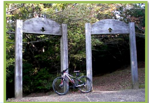
MTB コースの入り口・出口ゲート。木造りの門風で、雰囲気があり素敵だ。