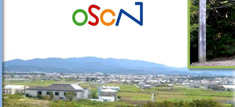
大仏山山頂より伊勢市方面を望む。コースからは、自転車を降りて来よう。