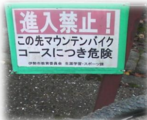
歩行路との交差部分には、MTBコースを示す看板が設置されている。とはいえ、歩行者優先で楽しみたい。