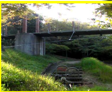
歩行者用の吊り橋の下を、くぐり抜ければ、もうすぐゴールだ。