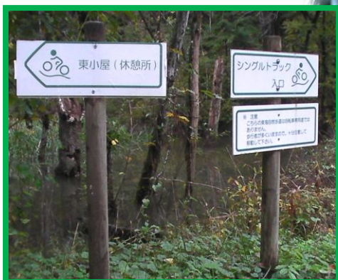
自転車の絵が描かれたルート板！安心して走れる。