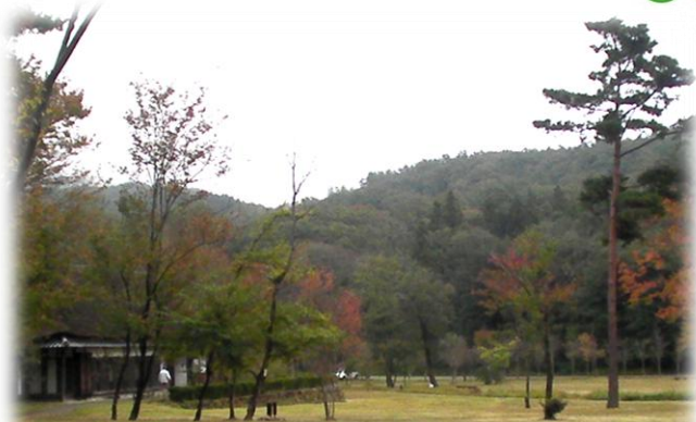
木々のまばらな開放感あふれる芝生のエリア横には、古民家が移設されており、雰囲気が素敵だ。このエリアは走行禁止である。移動が必要なら、自転車を押していく。