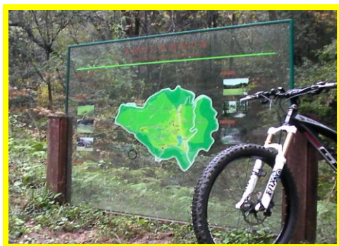
各務野自然遺産の森にふさわしい素敵なルート板がある。森の中でのアウトドアスポーツの気分が高まる。

おすすめポイント： 行政と地元のサイクルショップが協力して設定したコース。東海圏では、MTB 走行を公認で出来る場所として人気が高いコース。基本コースは、1.6km、テクニカルな部分も有り、体力UPや基礎技術向上トレーニングのコースとして最適だ。公園の景色も素敵で古民家がある。