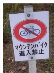
歩行者のトレールや広芝生等の走行禁止エリアには入らないよう気をつけよう！シェア・ザ・パークである。