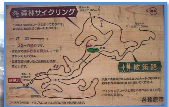
森林サイクリングの看板が各所にあり、ハイカーとの共通認識に、大きな役割を果たす。