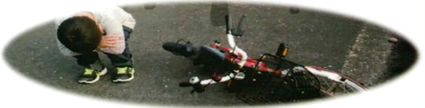
■ 守山警察署管内 交通事故死傷者